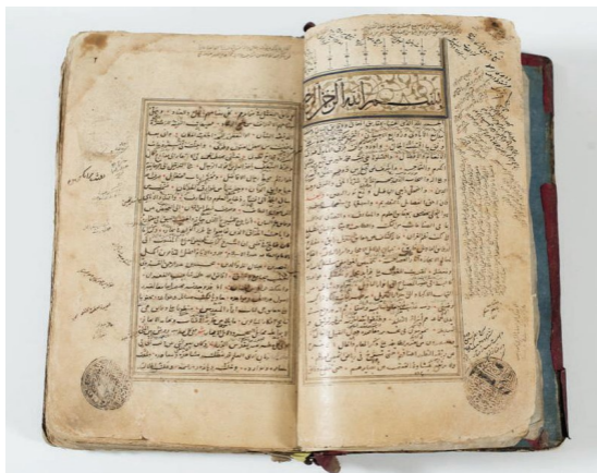
Fig. 24 : L'importance des bibliothèques dans l'empire shibanide : un manuscrit déposé en waqf au XVI ème siècle dans un sanctuaire d'Asie centrale avec dans les marges des cachets attestant de ce waqf ; il s'agit d'un Šarh al-mutawwāl d'al-Taftazānī copié en Asie centrale dans la seconde moitié du XV ème siècle, avec de nombreuses gloses marginales, ms. ARA 719 de la BULAC (Paris).

Manba: Ushbu sahifa hozirda Parijdagi U.C.A.D. (Union Centrale des Arts Décoratifs) fondida saqlanmoqda va Luvr muzeyining Islom san'ati bo'limiga topshirilgan (inv. raqami: AD 27658/2 verso).